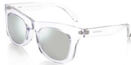
Josh / 4 色