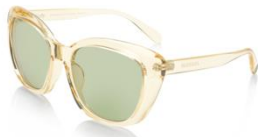
Judy / 4 色

「JINS&SUN」を象徴するコレクション。NIGO®氏が数あるサングラスの過去のデザイン要素までさかのぼり、Vintage をひも解きました。リバイバルやオマージュではなく、素材、サイズ、かけ心地、カラーすべてに現代的なアレンジを加えて昇華させた“Next Vintage”サングラスです。